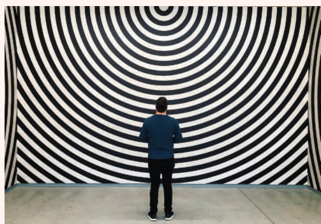
Sol LeWitt - Wall Drawing 462

L'extrême droite et ses alliés fortunés mènent, parallèlement et parfois conjointement, une bataille culturelle contre les espaces de liberté d'expression et de création. Dans leurs attaques, qu'elles soient dirigées contre l'audiovisuel public ou contre le monde de l'édition, les artistes comme les journalistes sont autant de dangereux militants « wokes » qui menacent notre nation. Entre cen-