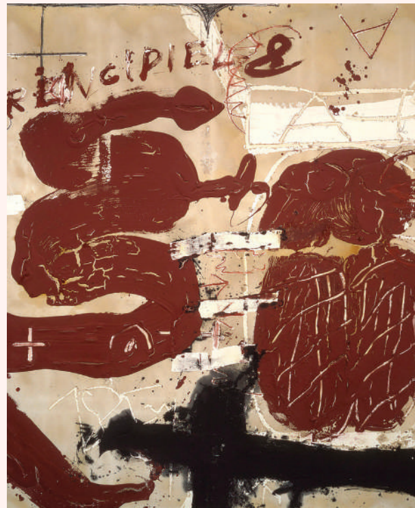
Antoni Tàpies - La croix et la matière

Face à ce démantèlement, l'appel de L'APRÈS lancé le 22 juillet 2025 résonne comme un signal d'alarme. Il ne s'agit plus seulement de réclamer des budgets, mais de défendre un modèle de société. La culture n'est pas une va-