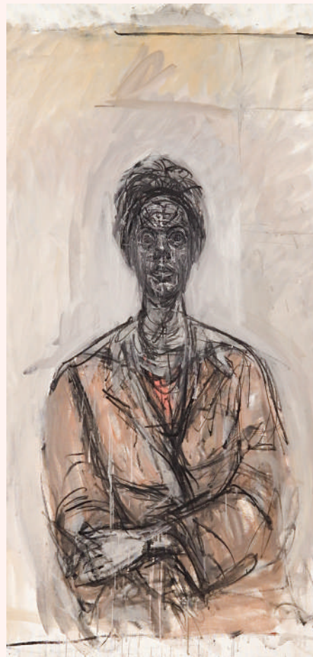
Alberto Giacometti, Caroline, 1961