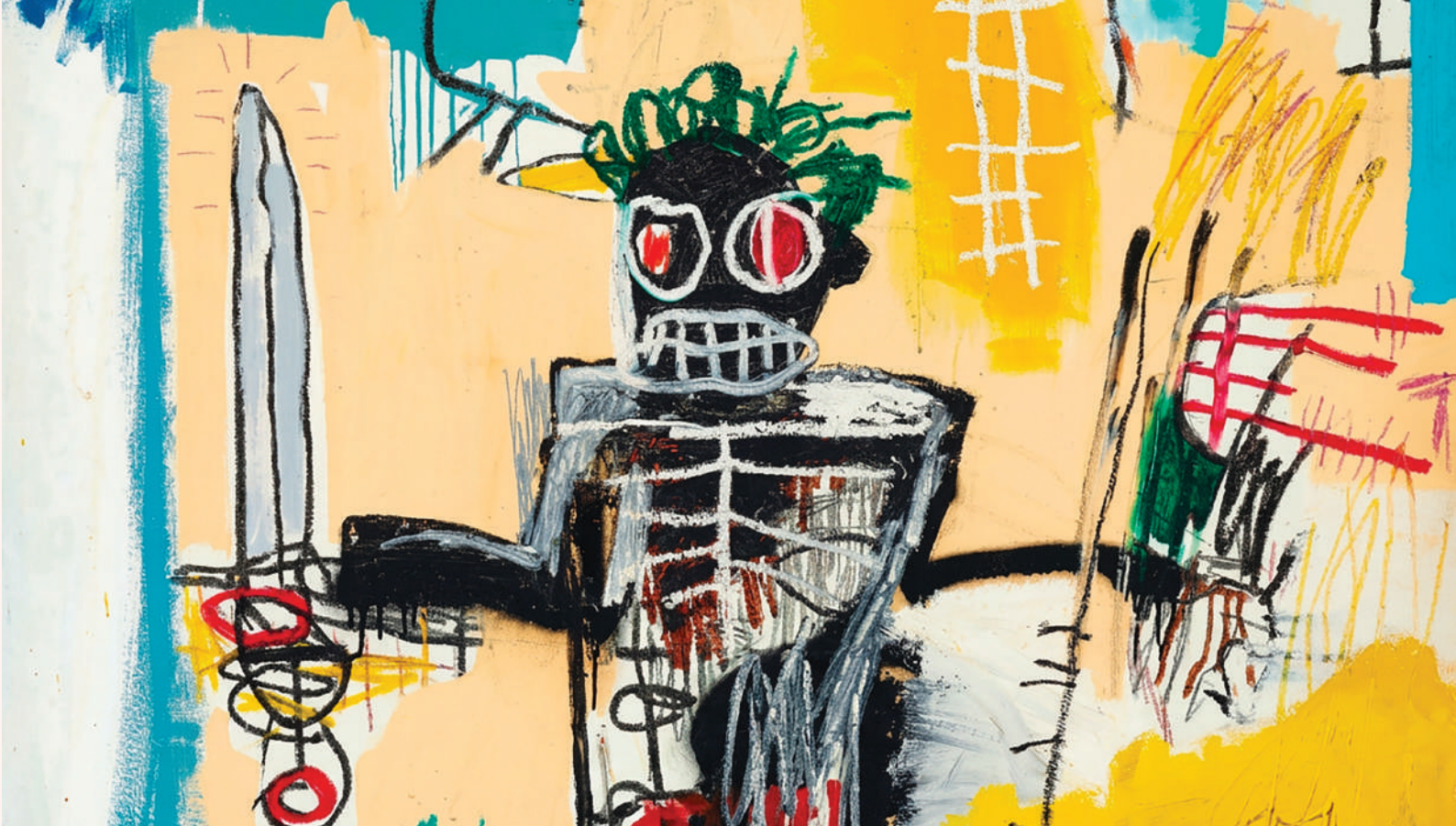
Warrior de Jean-Michel Basquiat

dance éditoriale et à la liberté de création. Pour beaucoup, cette éviction symbolise les dangers liés à la concentration croissante des médias et de l'édition entre les mains de quelques grands groupes privés.